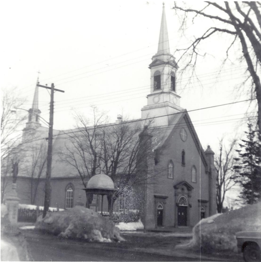
Figure 4: Le kiosque de la criée en 1961...