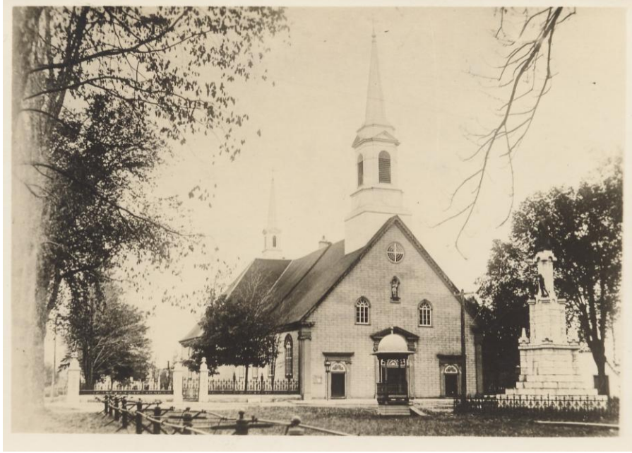
Figure 2: le nouveau kiosque entre 1913 et 1919