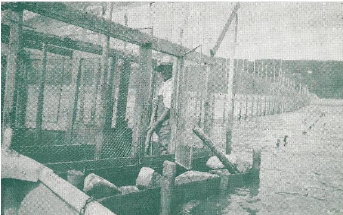
026 - PECHE A L'ANGUILLE, ILE D'ORLÉANS, QUÉBEC - EEL FISHING, ISLAND OF ORLEANS, QUEBEC

Le lendemain matin, nous aidions notre père à charger les poches d'anguilles dans deux voitures. Il était difficile de manœuvrer les poches à cause du limon. Par la suite mon père est parti pour Québec, à la Dominion Fish, située sur la rue Dalhousie. À cet endroit, les poches étaient pesées, puis vidées dans des réservoirs pleins de saumure. L'anguille nageait dans cette eau salée concentrée et mourait. Le tout pesait 2500 livres et à trois cents la livre, cette vente rapporta 75 piastres. Quelle somme d'argent! Ces anguilles étaient exportées en Allemagne.