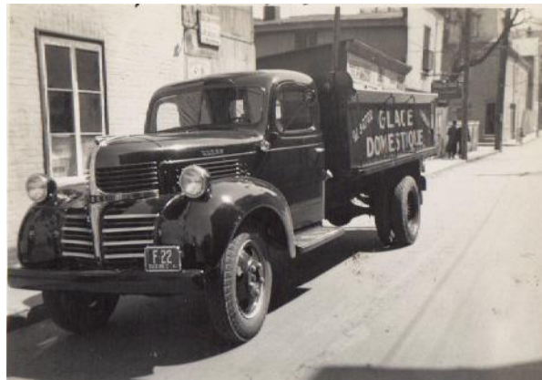
Camion servant à la distribution de la glace, rue Durocher, ville de Québec, 27 avril 1941.

Ce commerçant vendait la glace à Québec durant l'été aux maisons privées par petits blocs de 1 pied carré environ. Des camions venaient chercher la glace au lac St-Augustin où des ouvriers l'avaient préparée. Tout un réseau de distribution était organisé surtout pour les commerces et les grossistes. Apparemment la famille Holden est devenue très riche avec ce commerce.