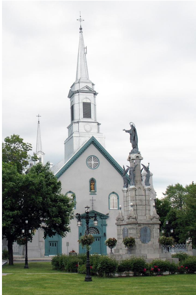
Figure 3: Monument du Sacré-Cœur en 2009