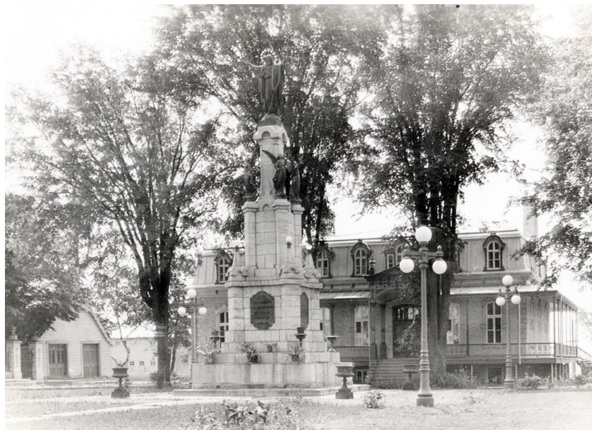
Figure 2; Monument du Sacré-Cœur vers 1940